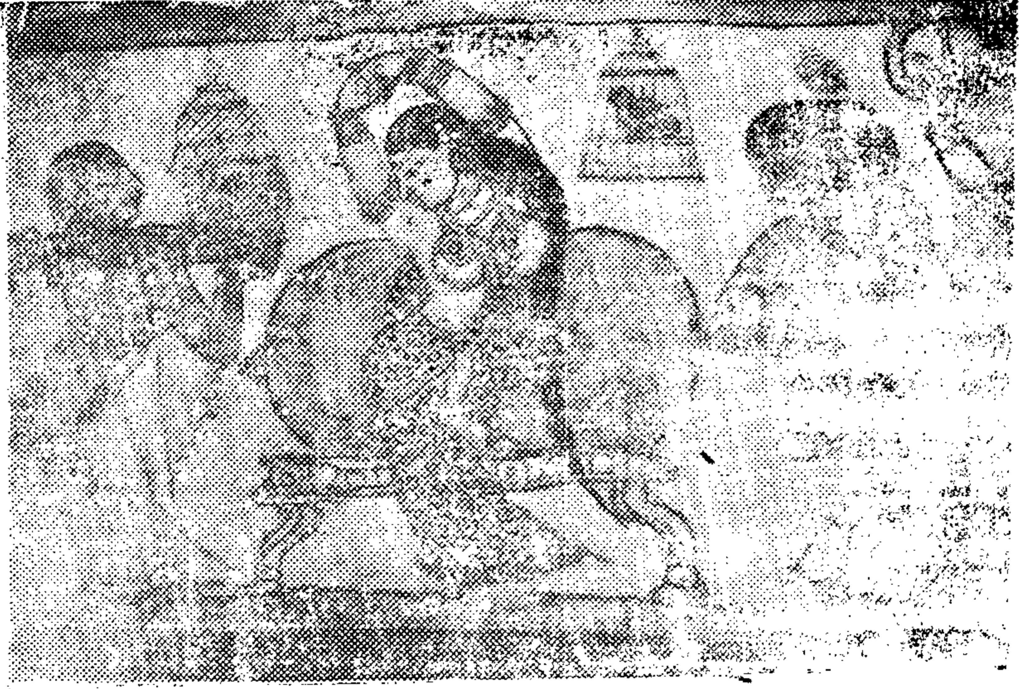
அரசி கண்ணாடிப் பார்த்து அலங்கரித்தல்

இவ்வோவியத்தில் பெண்களின் உருவங்களினாலேயே ஓர் யானையைப் போலவும் அதன்மீது அரசர் அமர்ந்து கரும்பு வில்லால் மலர்க்கணையினை அரசியை நோக்கித் தொடுப்பது போலவும், அதன் எதிரே பெண்களின் உருவங்களினாலேயே அமைந்த குதிரை உருவம் வரையப் பட்டு அதன் மீது அரசி அமர்ந்து அரசர் மீது மலர்க்கணை தொடுப்பது போலவும் உள்ள ஓவியம் எத்துணை முறை பார்த்தாலும் மீண்டும் பார்க்கத் தூண்டும் வண்ணம் அழகாக வரையப்பட்டுள்ளது.